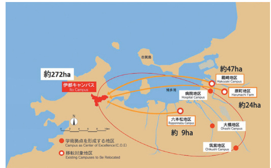
■九州大学のキャンパス計画マップ

都市の近郊という利便性を持ちながら、玄界灘に望む豊かな自然が残された静謐な環境にあります。また、ここは、古くから朝鮮半島などからの往来が盛んであったことを示す遺跡が数多く存在する歴史